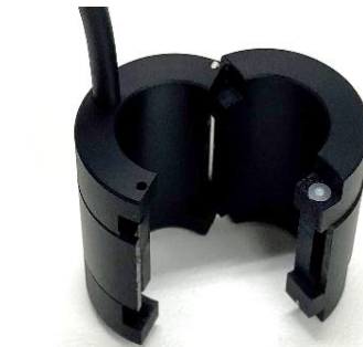
センサヘッド開閉機構